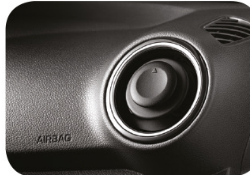
Ductos de aire rotatorios 360°