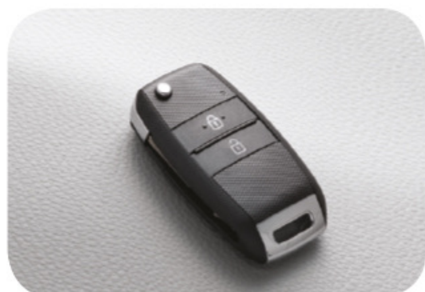
Llavero remoto plegable