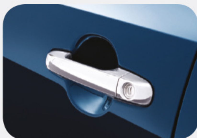
Manijas exteriores de puerta cromadas