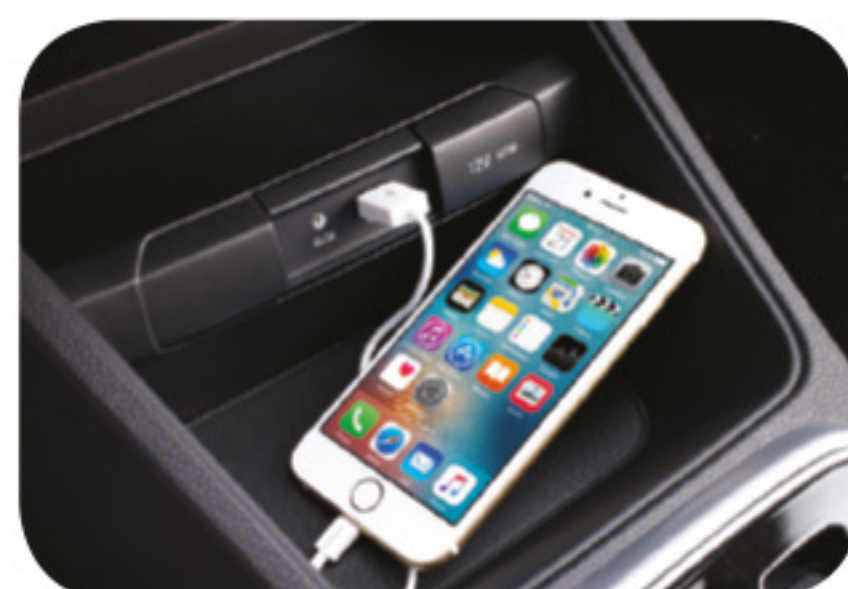
Conexión AUX y USB con bandeja de dos niveles