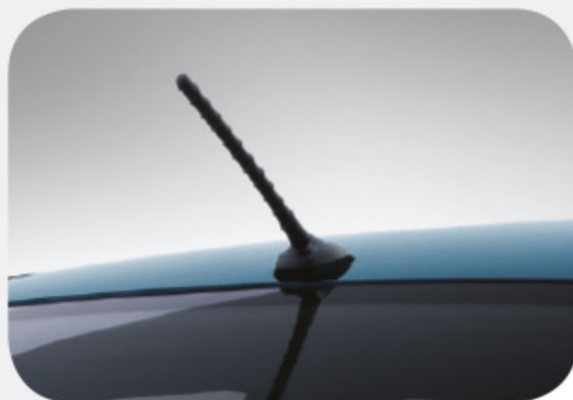
Antena tipo poste