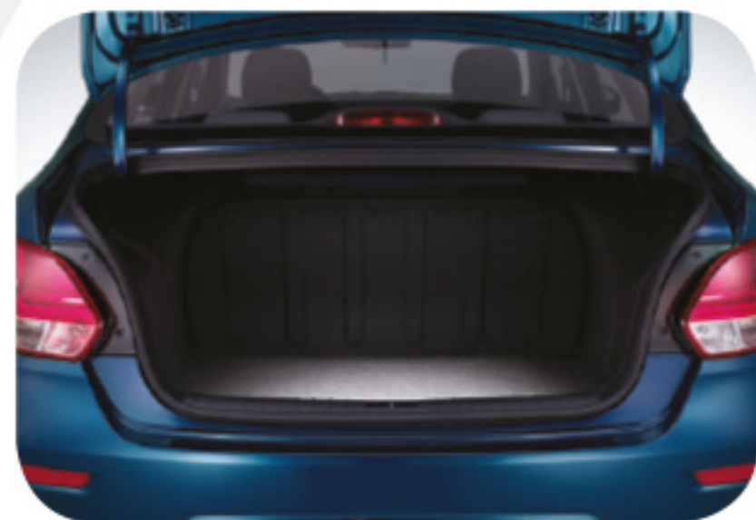
Compartimiento de equipaje con iluminación (475 L)