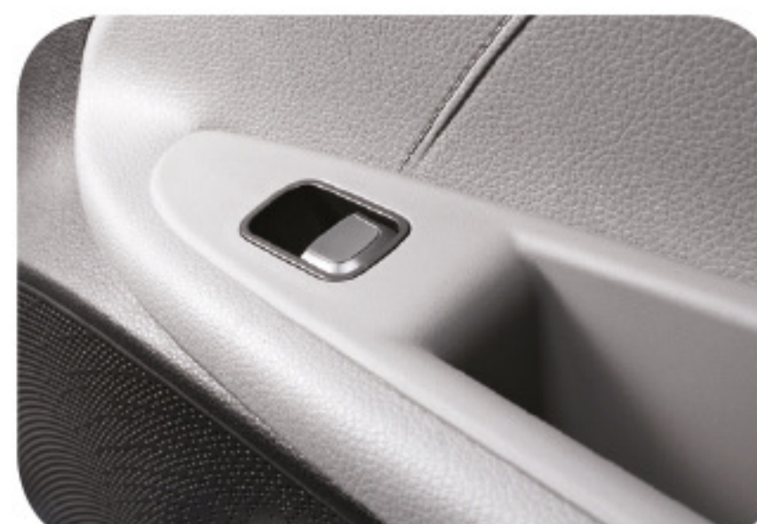
Ventanillas automáticas en puertas traseras