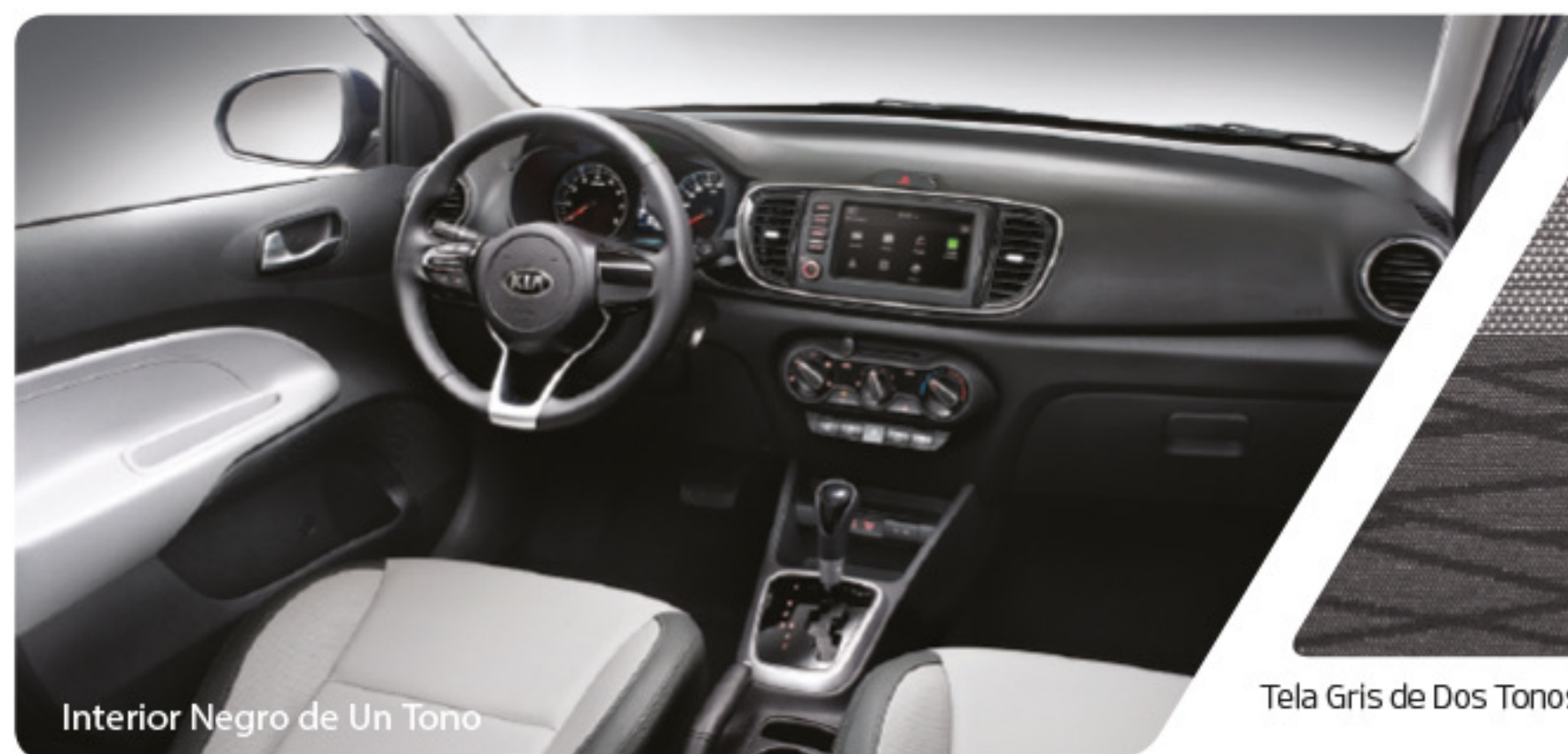
Interior Negro de Un Tono