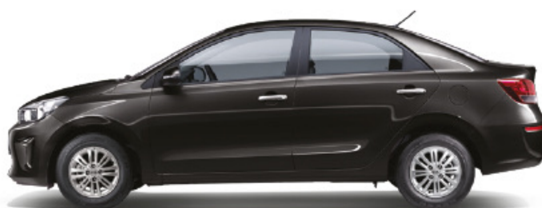
Aurora Negra Perlada