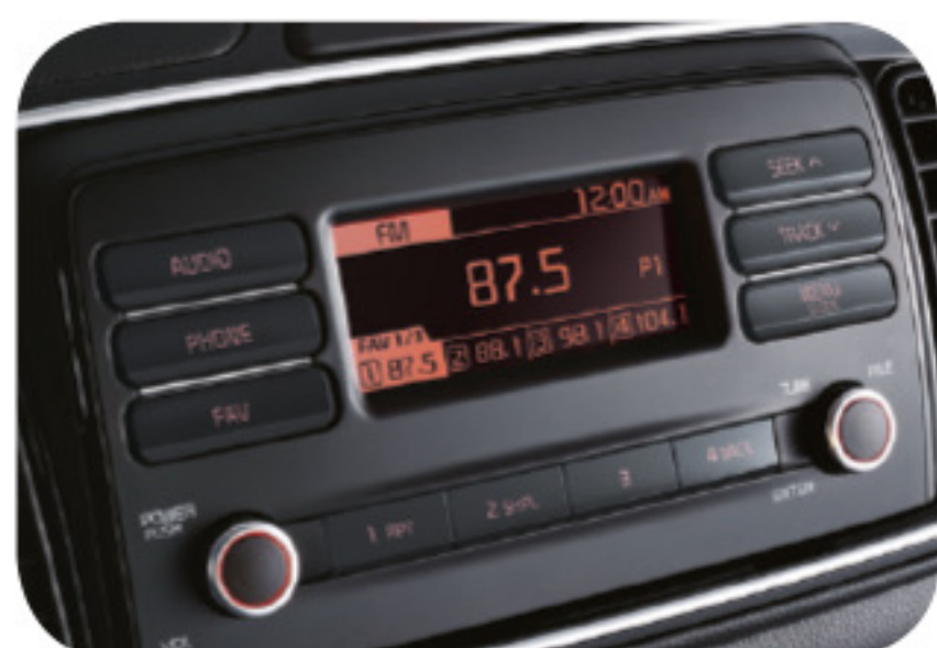
Pantalla de audio de 3.8 pulgadas