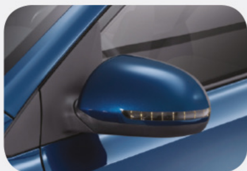
Espejos exteriores eléctricos ajustables con intermitentes LED