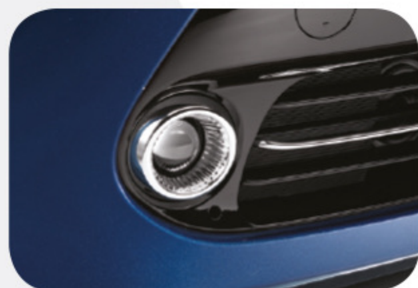
Luces antiniebla de proyección