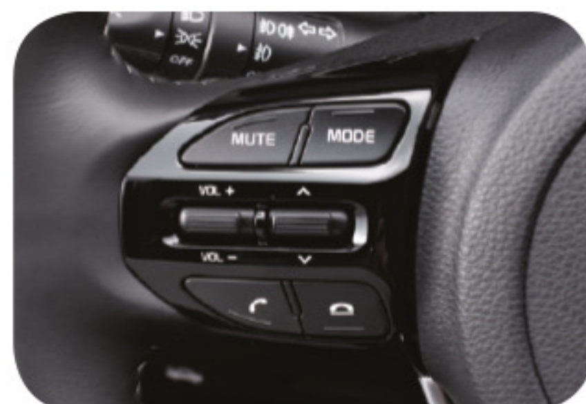
Control remoto de audio