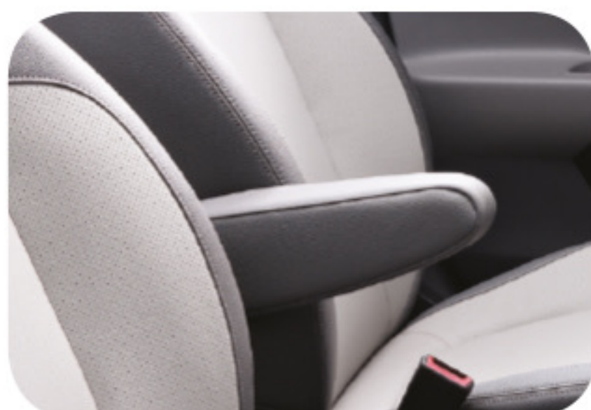
Apoyabrazos en asiento del conductor