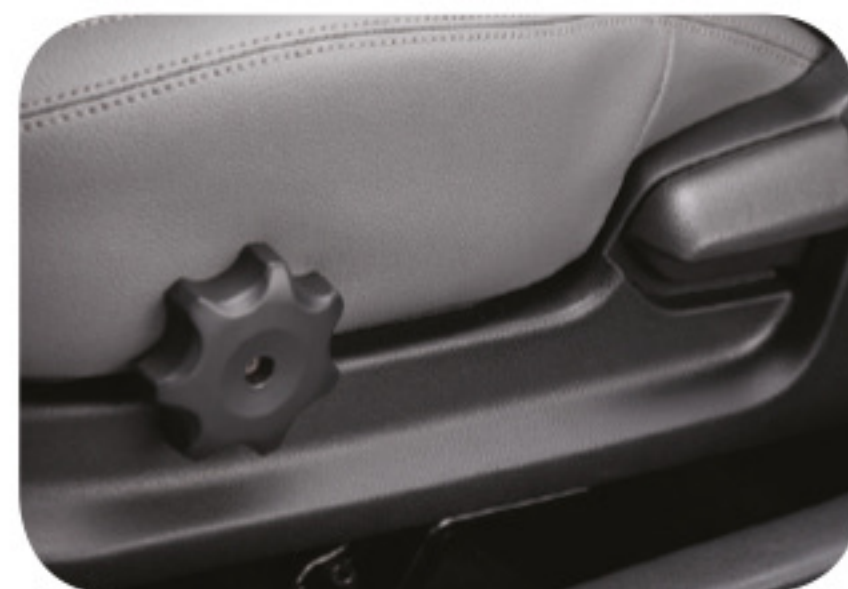
Ajustador de inclinación del cojín para el asiento del conductor