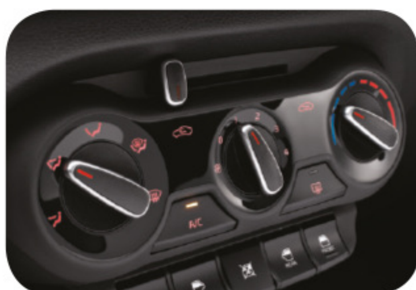
Control manual de temperatura