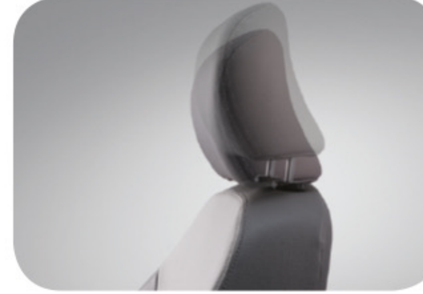
Reposacabezas del asiento delantero con altura ajustable