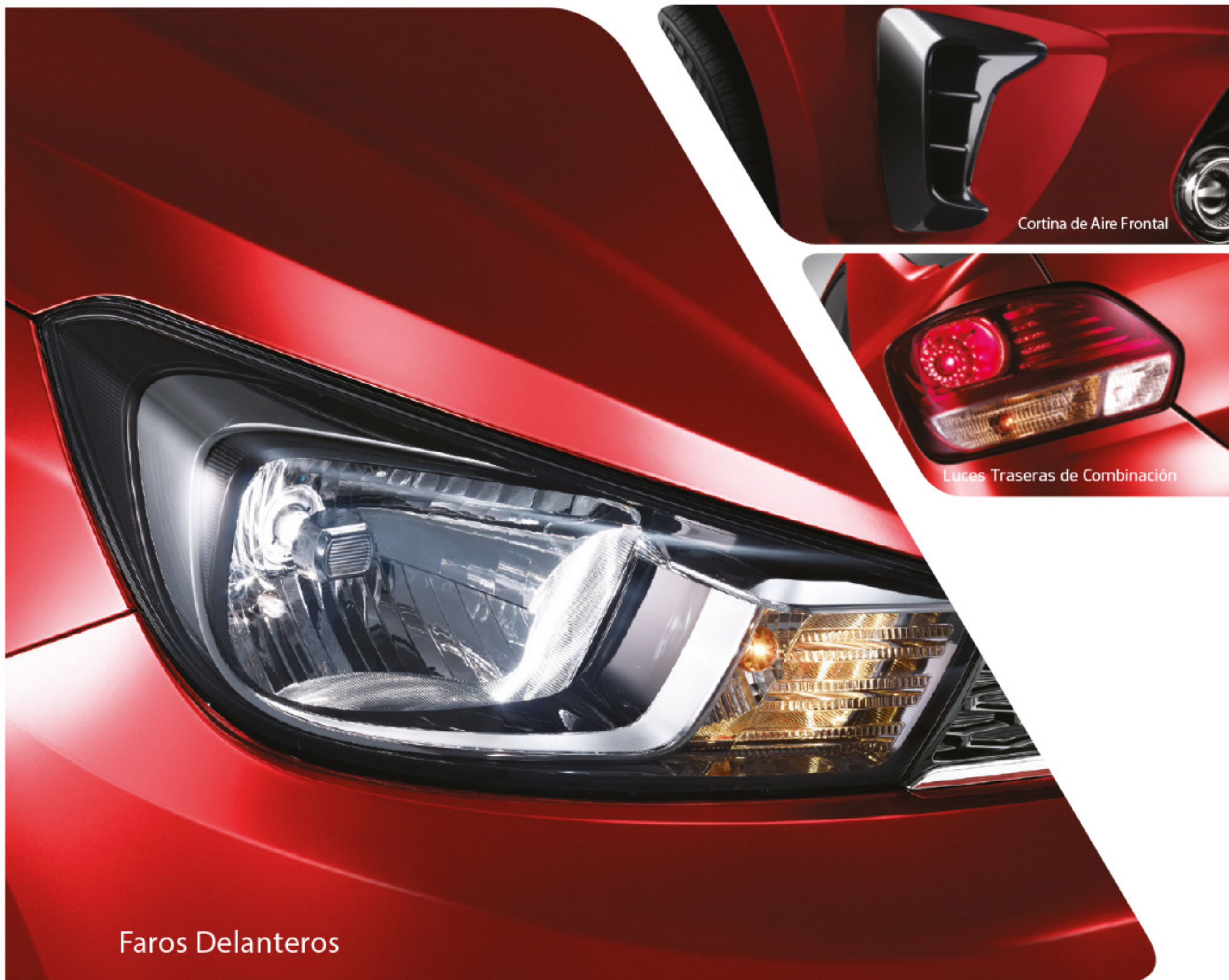
Cortina de Aire Frontal

A VECES LAS LÍNEAS MÁS BELLAS SE MANIFIESTAN A TRAVÉS DEL MOVIMIENTO